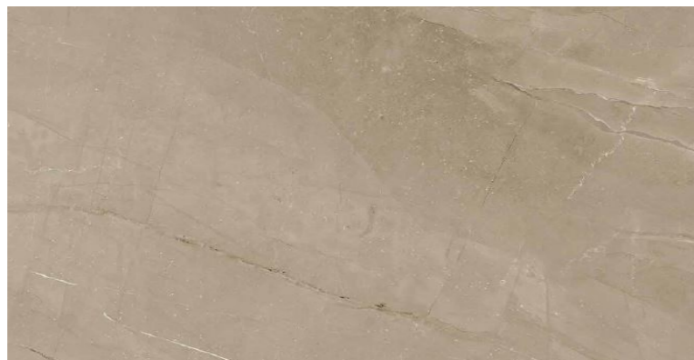
ΠΟΥΛΠΙΣ ΤΑΟΥΠΕ ΜΑΤ 60x120 0260120430