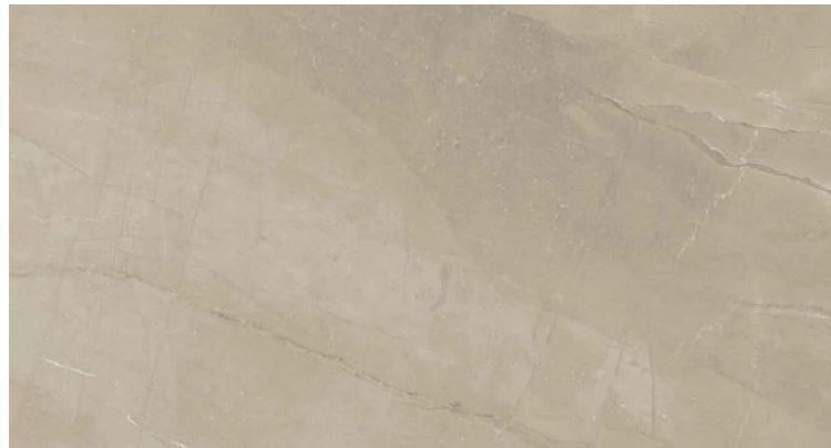
ΠΟΥΛΠΙΣ ΓΚΡΕΙΓΚΕ ΜΑΤ 60x120 0260120429