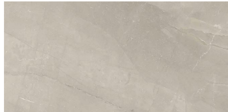
ΠΟΥΛΠΙΣ ΣΙΛΒΕΡ ΜΑΤ 60x120 0260120427