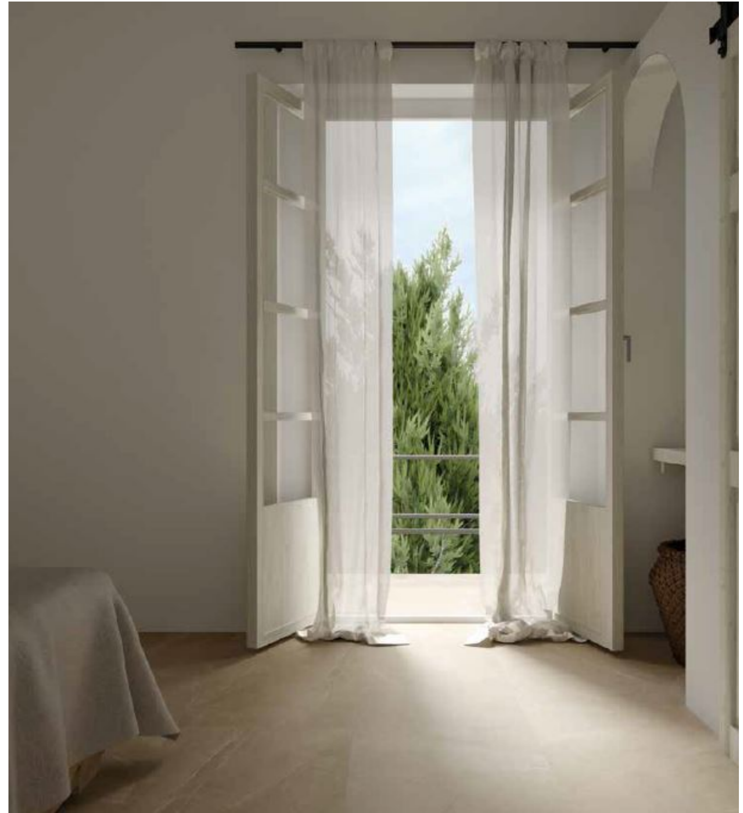
ΠΟΥΛΠΙΣ ΤΑΟΥΠΕ ΜΑΤ 60x120cm