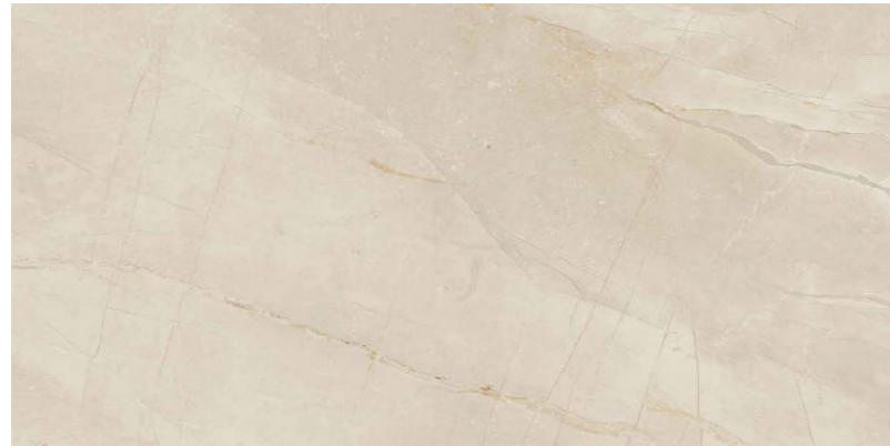
ΠΟΥΛΠΙΣ ΑΛΜΟΝΤ ΜΑΤ 60x120 0260120426