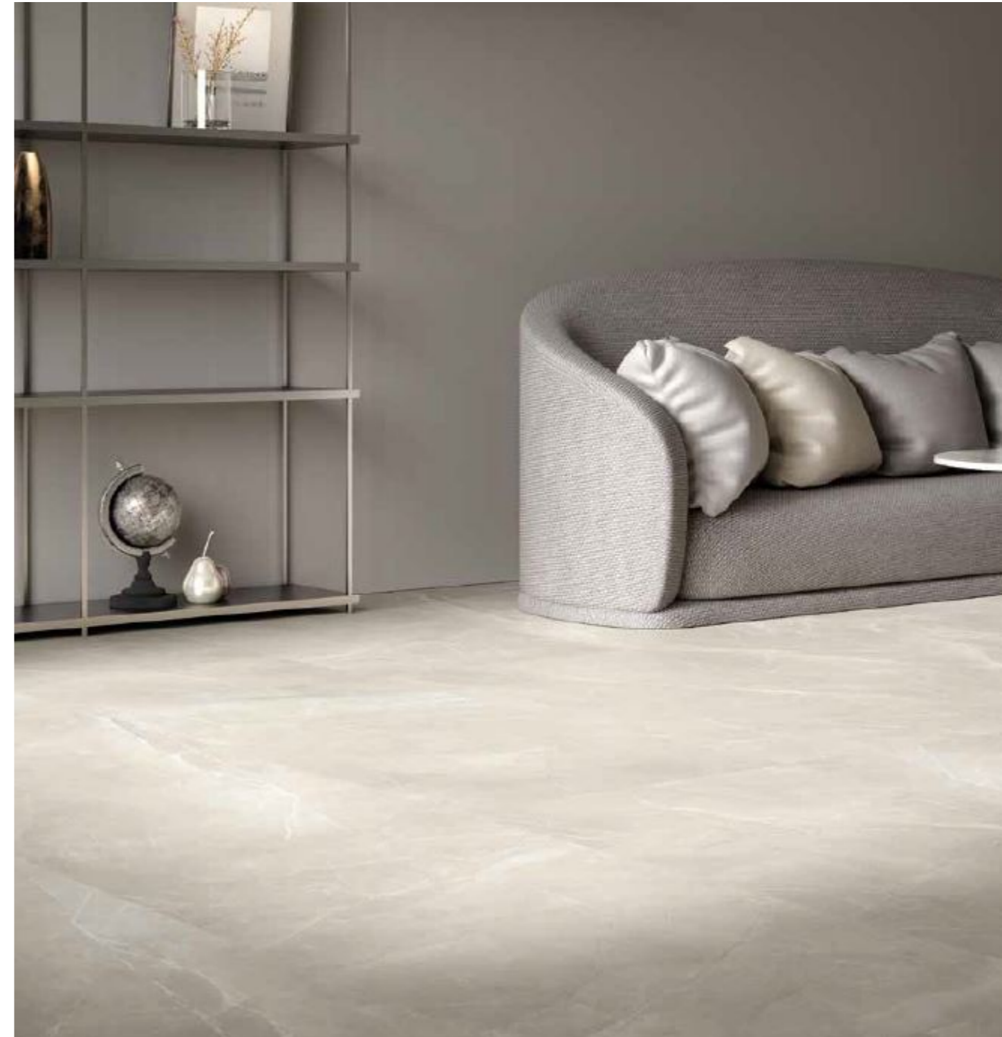
ΠΟΥΛΠΙΣ ΣΙΛΒΕΡ ΜΑΤ 60x120cm