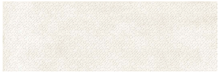
BIZION FOYAIT NTEKOP MAT (29,5x90) 0130900113