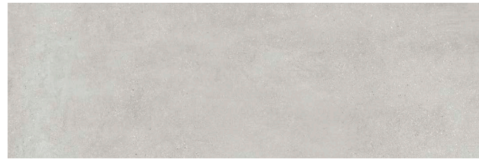
BIZION NATOYPAΛ MAT (29,5x90) 0130900115