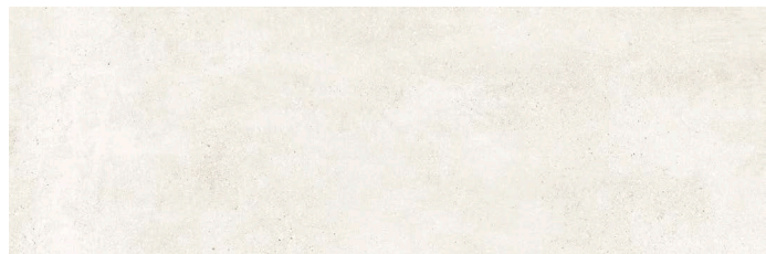
BIZION FOYAIT MAT (29,5x90) 0130900112