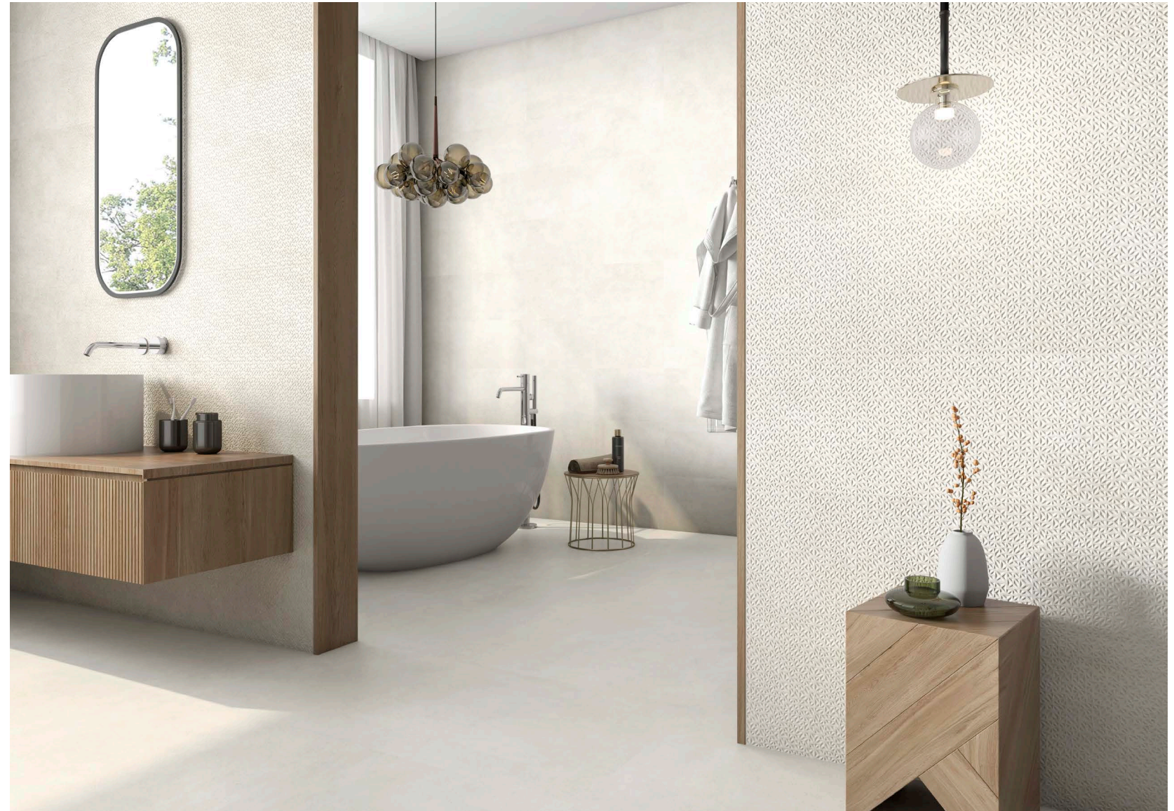
BIZION FOYAIT NTEKPO MAT (29,5x90)