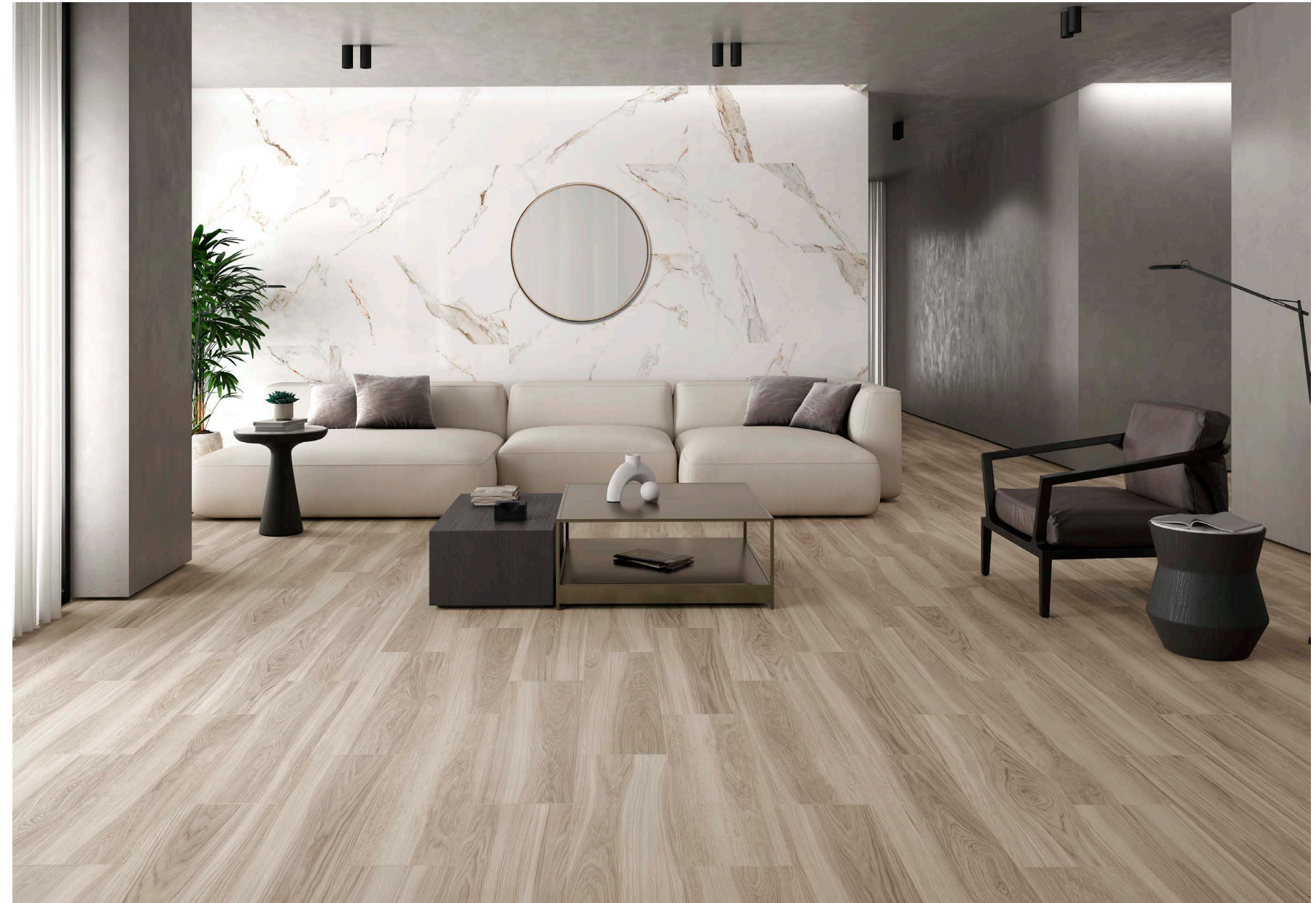
ΦΙΛΓΟΥΝΤ ΝΑΤΟΥΡΑΛ ΜΑΤ (22x84)